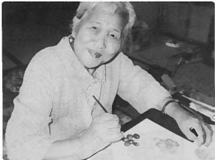
おめさんも描きなせや!