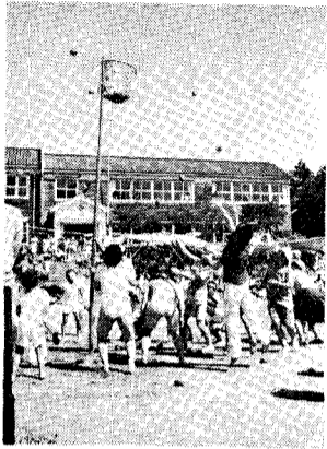
猛暑の中で大熱戦

●矢代田分館 山の手運動会終了 台風六号が通過した翌日、八月二十四日に快晴のもと恒例の運動会が行われました。