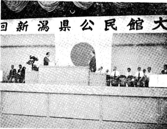
新潟県公民館大会

稲 架 稲架が黄金の扉で村々を囲むと 越後路は秋になる 乾いた葉の音がかさかさとして鳴り 稲架の乾いたにおいが刈田に漂い 稲が幾つもとびはね 間切りの窓の翳雲は 秋の日のなつかしい田舎 稲架のある田舎もめつくり減って 越後の秋は誰が告げる ※ 次回のテーマは自由です。