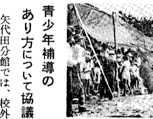
青少年補導のあり方について協議

選手・応援団とも合わせて約七百名が参加し、矢代田小学校グラウンドへと走り廻り、町民運動会へ向けて大ハッスル。 山の手運動会自慢の応援台戦は、一位矢代田B、二位矢代田Aチームでした。なお、今日大会の総合成績は次のとおりです。