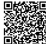
かんたん申し込み 二次元バーコード