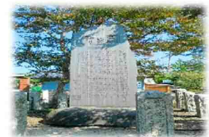
「小熊幸一郎改築碑」