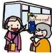
鮓・割烹「いじま」にて 昼食休憩