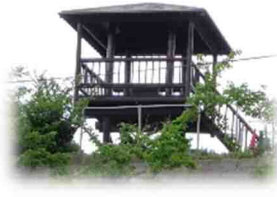
松浜橋・新潟空港が一望できる 「アカシア公園」