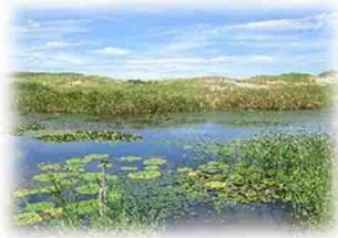
ひょうたん池 水生生物・植物の宝庫