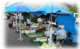
松浜の朝市にてお買い物 をお楽しみください