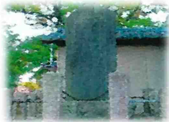
松浜の繁栄の基礎を築いた 村山得次郎頌徳碑