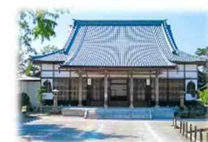
400年以上の歴史「西厳寺」