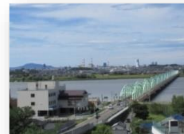
あかしあ公園から松浜橋と角田山を望む