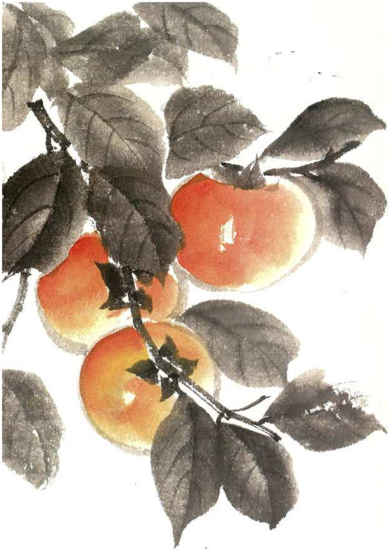
【七色の会 会員作品】