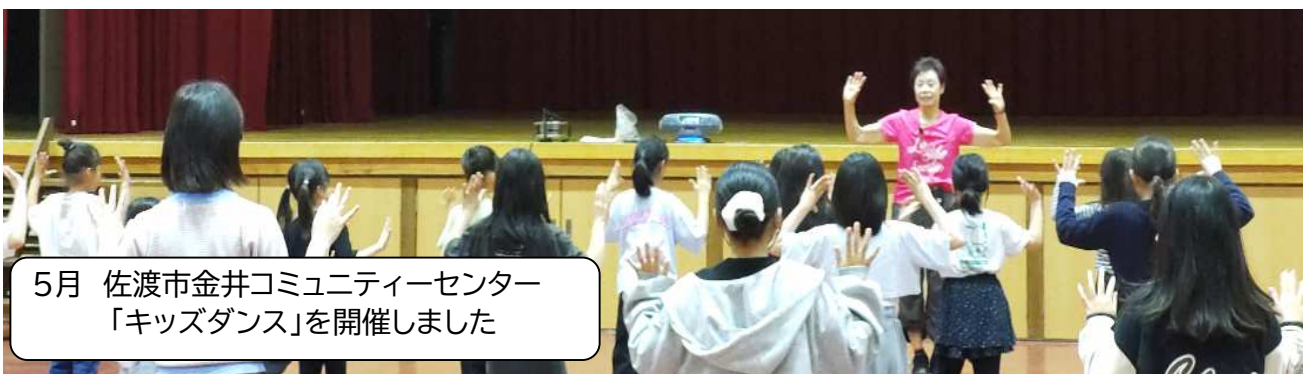
5月 佐渡市金井コミュニティーセンター 「キッズダンス」を開催しました