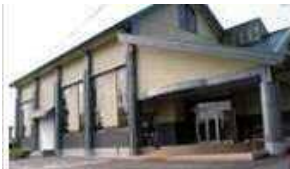
※やすらぎの森公園の隣です。