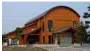
※にししろね保育園の隣です。