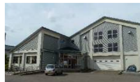
※味方郵便局の隣です。