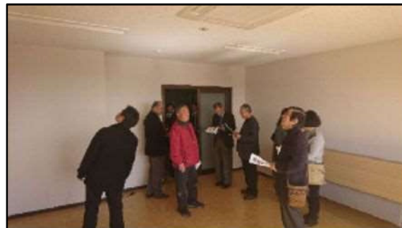
【燕市】 『燕市民交流センター』