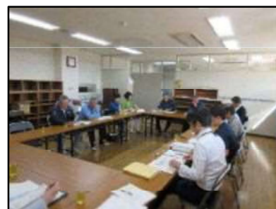
【H29.9月】 第1回検討委員会の様子

平成29年度は9月と1月に検討委員会を開催したほか、他都市の複合施設を視察しました。