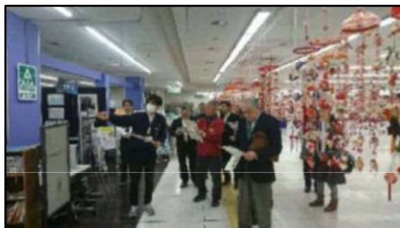
【見附市】 市民交流センター『ネーブルみつけ』

コミュニティ施設は、特定の人だけではなく、こどもから高齢者まで、多世代が交流できる施設を目指します。