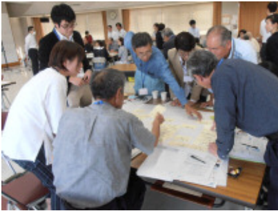
第1回ワークショップの様子

これらをきっかけとして、市営住宅跡地の活用や、保育園を含めた地域の公共施設のあり方について、地域のみなさんと市・区役所がともに考えるワークショップが開催されています。