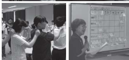
ほっと・HOT 中条視察の様子