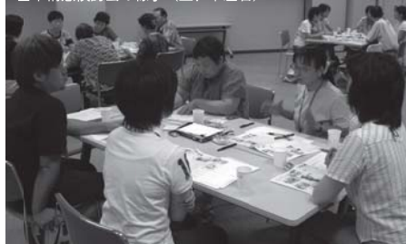
基本構想検討会の様子 (上、中左右)