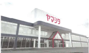
今夏も長岡店でポップアップショップを開催予定。スタッフの自由な企画を見守る大らかな社風が現場をあと押ししています。