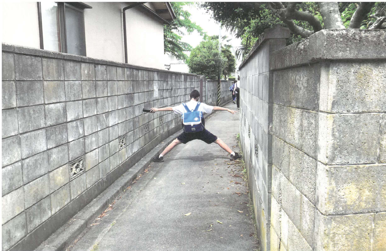
知りたいのは道の幅。大人では思いつかない斬新な計測方法だ。

亀田中学校では生徒が各々の視点で校区を巡って区の宝物を発見する総合学習「袋津巡検」を行いました。