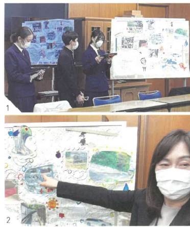
1.校内発表会のあと代表が江南区長を訪問してプレゼンテーションを行った。 2.イラストや文字がぎっしり書き込まれたマップを前に江南区長も興味津々。

「宝もの」魅力」を考えたあと、1学年240人をシャッフルして小さな班に分けて着眼テーマを決めて袋津を巡検しました。