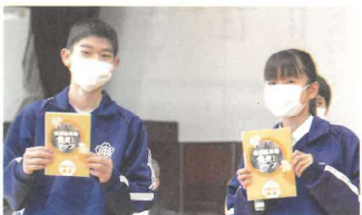
終業式で2年生から後輩たちへ手渡されたマップ。今年度はエリアを江南区全体に広げて実施する。