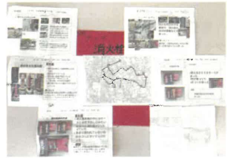
それぞれのテーマが明確、しっかりポイントを押さえたマップング。

◀ 地域巡検をまとめた新しいまち歩きマップ。裏面は袋津の白地図になっていて自分だけの地図が作れる。