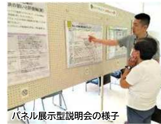
パネル展示型説明会の様子

〈発行者〉大江山地域実行計画コミュニケーション事務局 令和6年2月発行 (江南区地域総務課: ☎025-382-4619 財務部財産活用課: ☎025-226-2387)