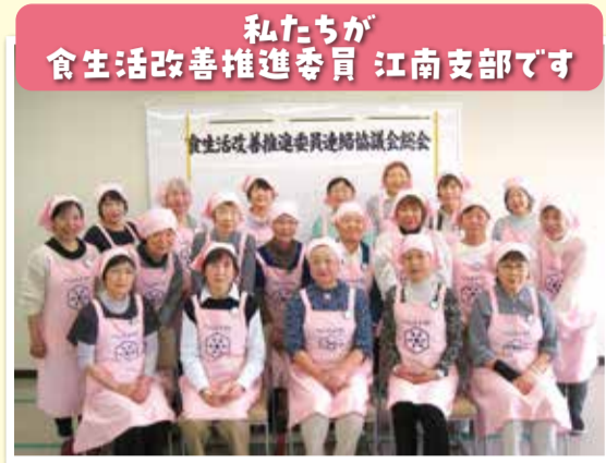
私たちが食生活改善推進委員 江南支部です