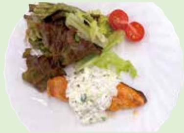
鮭のチーズタルタル