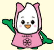
新潟市食育・花育推進キャラクター まいかちゃん

飴色玉ねぎは、たくさん作って小分けにして冷凍しておく、カレーやシチューなどの煮込み料理にも活用できるので便利です。