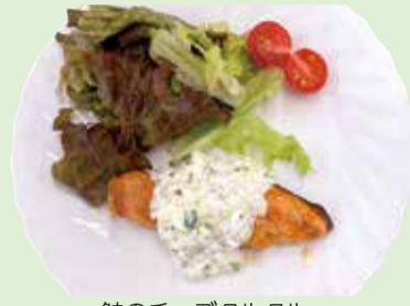
鮭のチーズタルタル