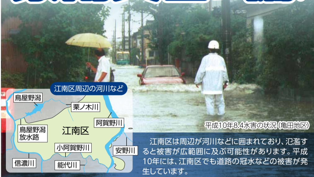
平成10年8.4水害の状況(亀田地区)

江南区は周辺が河川などに囲まれており、氾濫すると被害が広範囲に及ぶ可能性があります。平成10年には、江南区でも道路の冠水などの被害が発生しています。