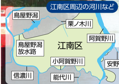
江南区周辺の河川など

江南区は周辺が河川などに囲まれており、氾濫すると被害が広範囲に及ぶ可能性があります。平成10年には、江南区でも道路の冠水などの被害が発生しています。