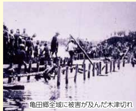
亀田郷全域に被害が及んだ木津切れ