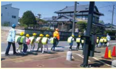
新入生の下校時の付き添い(亀田東小学校)

地域ごとに「民生委員・児童委員協議会(民児協)」が組織されています。ここでは、地域の課題を各自が持ち寄り、地域住民が安心して生活できるよう、課題解決に向けた独自の活動を展開しています。その他、地域の防災訓練の運営や、地域の居場所の運営などを行っています。