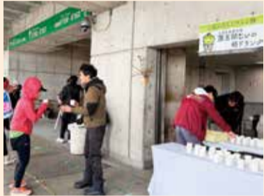
江南区自治協議会によるブース出展