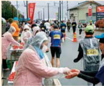
曾野木地区コミュニティ協議会による越後姫でのおもてなし

完走タイムを表示した撮影スポットでは、達成感に満ちた笑顔を見せる多くの人々の姿が見られました。