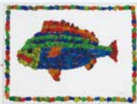
たけし「イサキの魚拓(松ぼっくり製)」