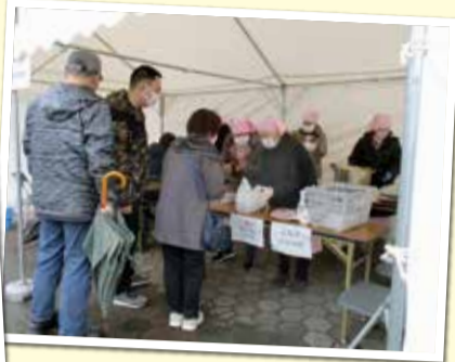
3月に開催した梅まつりでは、 藤五郎梅の梅干しご飯を販売しました