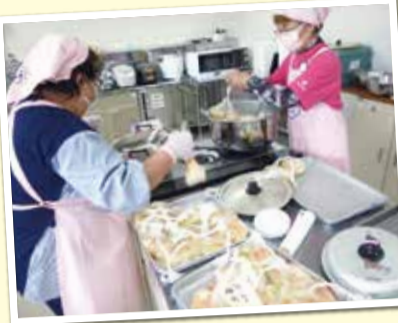
レシピ考案・試作の様子