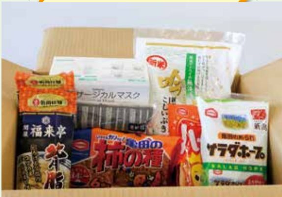
送付イメージ(昨年度の内容)