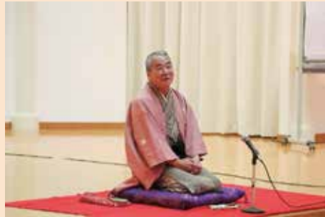
水都家艶笑さんの落語の様子