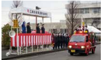
令和4年消防出初式の様子

自由に見学できます。 回 1月8日(日)午後2時～4時 場 江南区役所 敷地内 内 消防団車両などの行進 午後2時30分より2分間、隣接する亀田西中学校の北側道路で一斉放水を実施 場 江南消防署 地域防災課 ☎025-381-2327