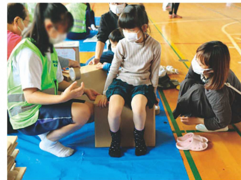
段ボールで作った椅子は意外と丈夫