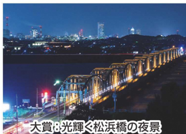
大賞:光輝く松浜橋の夜景