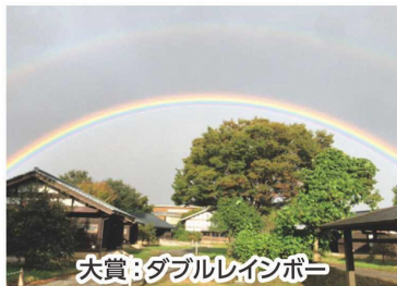
大賞:ダブルレインボー