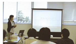
ボランティア講座