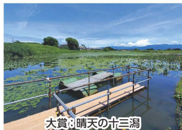
大賞:晴天の十三潟