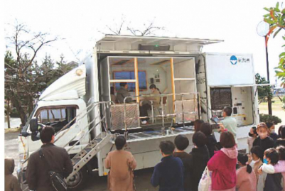
地震体験車による東日本大震災の揺れにびっくり