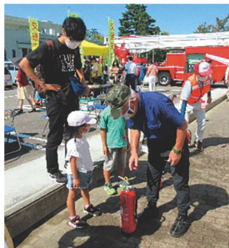
防災士が分かりやすく消火器の取り扱いを説明