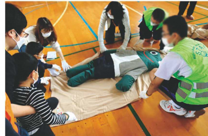
毛布を担架にして、カエル君を救出