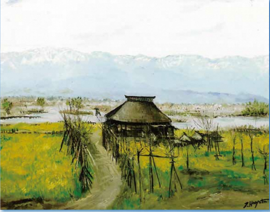
早津 剛「福島潟と潟来亭」2003年