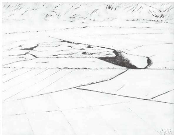
富岡惣一郎「雪、福島潟1」1993年

本年は、福島潟干拓の先駆者と言われる山本丈右衛門(現柏崎市出身)が江戸時代に潟の新田開発を開始(1756年)してからちょうど270年にあたります。このことから本展では、福島潟と人々の関係を、歴史・民俗・美術資料から紹介します。新潟市にある潟や湿地に、より親しむきっかけとなれば幸いです。