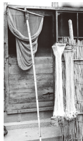
アオリズキ、サシアミ