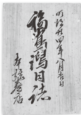
明治24(1891)年 福島潟日誌