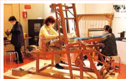
葛塚縞の実演の様子