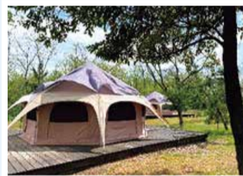
海辺の森キャンプ場