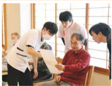
大学連携「未来のまちづくり」事業