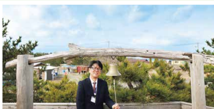
海辺の森キャンプ場内のパワースポットにて