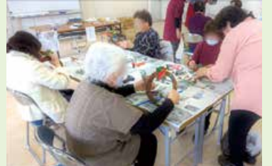
活動協力員(※)企画事業 (濁川・南浜公民館)