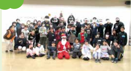
一休さん(北地区公民館) サタデイキッズ(豊栄地区公民館)