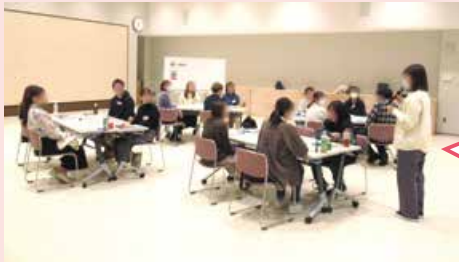
乳児期家庭教育学級「北っこBaby」