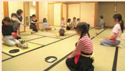
こども土曜公民館・茶道教室