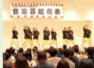
公民館まつり(豊栄地区公民館) 合同作品展(北地区公民館)