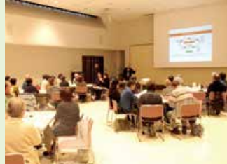
ご近所だんぎ (豊栄地区公民館)