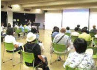
キネマ松浜劇場 (北地区公民館)