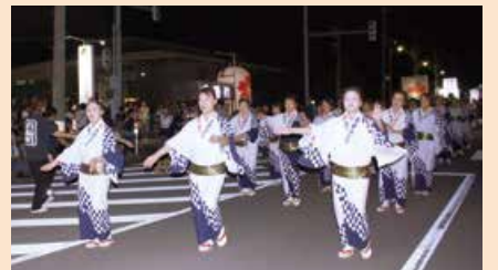
豊栄大民謡ながし(9月5日)