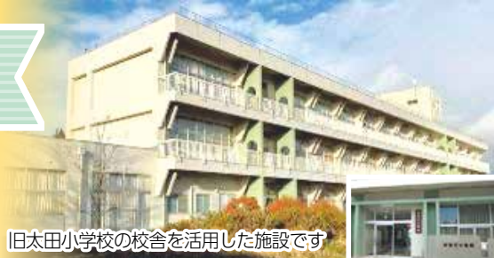
旧太田小学校の校舎を活用した施設です

1 資料の観覧 新潟市の古代から現代までの歴史を紹介する常設展のほか、所蔵資料の企画展があります。 ※今年度の企画展は終了