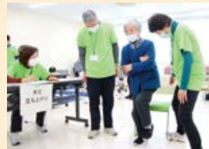
片足立ちテストの様子