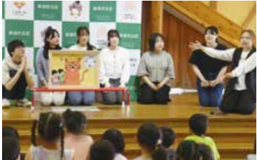
かやま保育園で紙芝居を披露

令和7年度新潟市の取組について～新潟の明るい未来を切りひらく！～ 市長が市民の皆さんの意見を聴く「市長とすまいるトーク」を開催します。