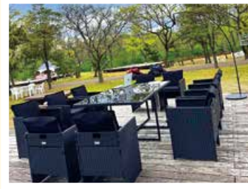
▲「グリーンオフィス」 ☎990円(1人2時間まで、ドリンク付き) ※プロジェクターレンタル、手ぶらでバーベキューなどオプションをつけられます