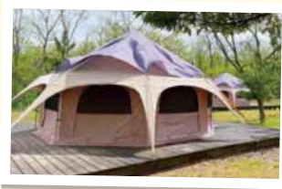
▲「あかしあ」常設テント ☎通常期 3,500円/サイト、 繁忙期 5,500円/サイト