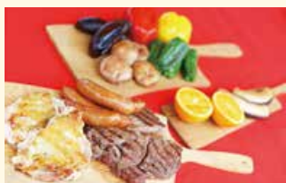
▲1ポンドステーキセット