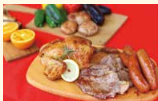
▲ローストチキンセット

※5日前までに予約が必要です(海辺の森ホームページから) ※写真は大人4人前です