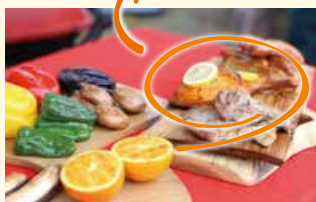
▲プランクサーモンセット