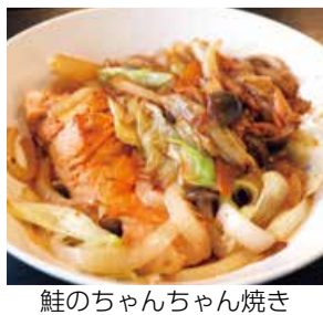
鮭のちゃんちゃん焼き