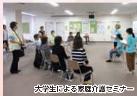
大学生による家庭介護セミナー