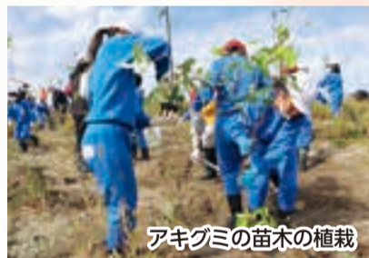
アキグミの苗木の植栽