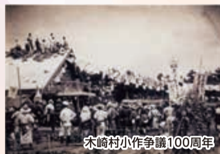
木崎村小作争議100周年