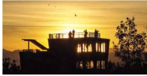
朝の雁晴れ舎。どんな景色かは現地でご確認ください。

水の上を参考一度は早朝の福島潟へお越しください。皆様最高の福島潟に出会えますように。