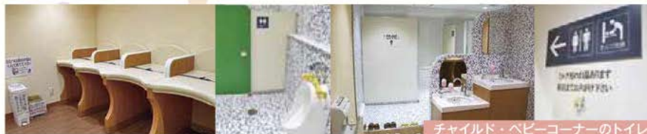
チャイルド・ベビーコーナーのトイレ

※ベビーベッドは、アイビススタンドの全女子トイレ、NILS21スタンドの多目的トイレ、チャイルド・ベビーコーナーのトイレにございます。