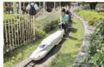
お子様に大人気のミニ新幹線