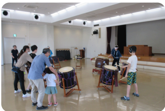
越王太鼓保存会 ×(福)新潟地区手をつなぐ育成会 フェリクス曽根