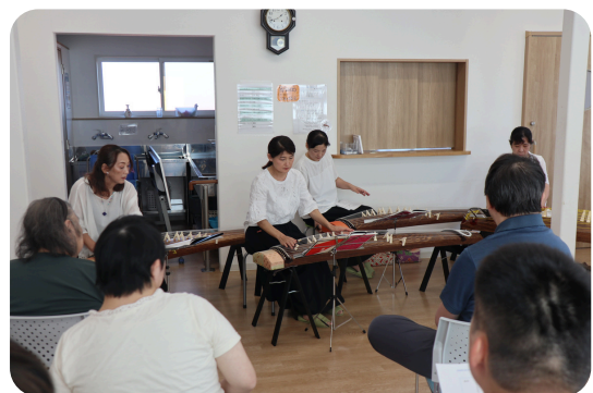
梓会 ×NPO法人eばしょ結屋