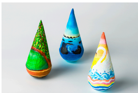
双葉《美人林》、《万畳敷》、《夕映えの白鳥》 水性絵具・アクリル絵具、粘土・和紙・カプセル容器