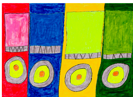
本間 航《牛乳と生卵》 フェルトペン、画用紙