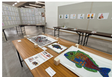
アピタパワー新潟亀田店