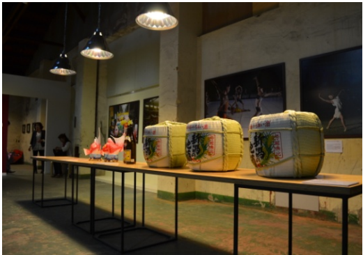
【新潟市】酒樽、鯛車などの展示