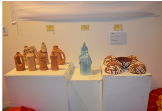
【青島市】工芸品の展示