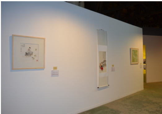
【青島市】絵画の展示