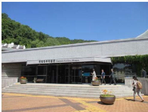
清州国立博物館外観