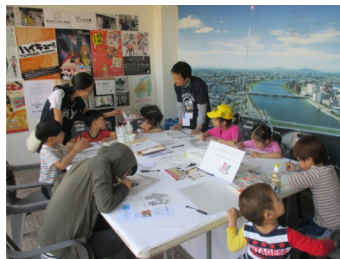
【新潟市】スクリーントーン体験