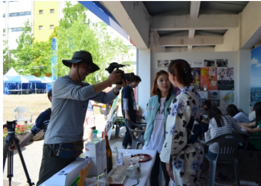
KBSによる新潟市広報ブースの取材