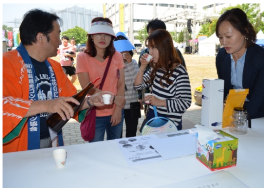
【新潟市】日本酒試飲