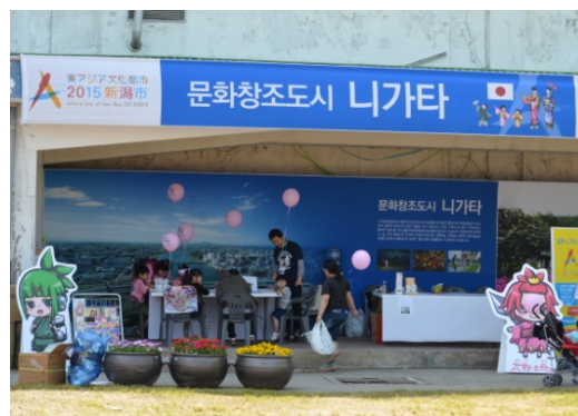
【新潟市】広報ブース