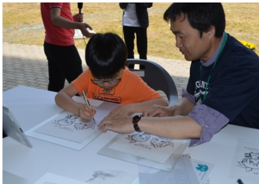
【新潟市】スクリーントーン体験