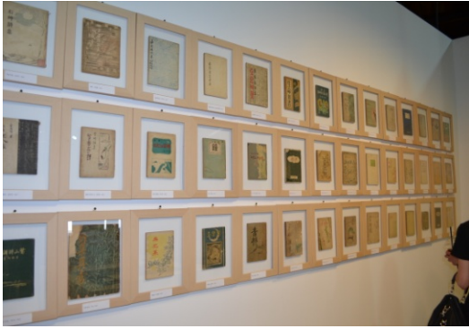
【清州市】市民愛蔵品の展示