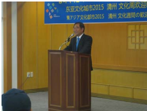
【清州市】李承勳市長挨拶