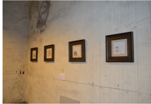
【青島市】絵画の展示