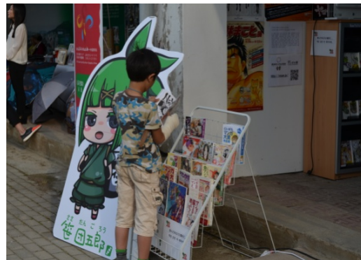
【新潟市】マンガ閲覧コーナー