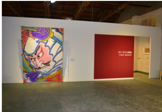
【新潟市】白根大凧の展示