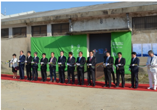
展示会テープカット（5月21日）