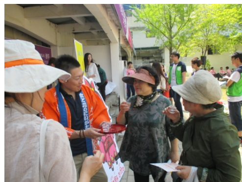
【新潟市】日本酒、日本茶試飲