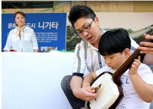
【新潟市】三味線体験