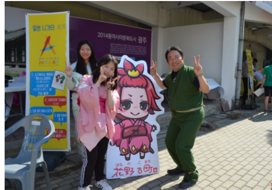
【新潟市】コスプレ写真撮影