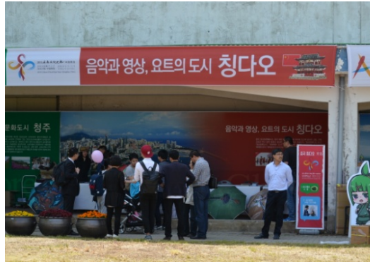
【青島市】広報ブース