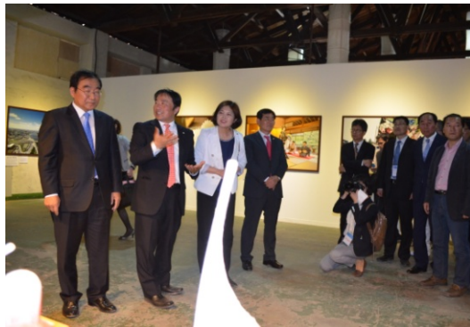
【新潟市】の展示について、李承勲清州市長へ説明する様子 (5月21日)