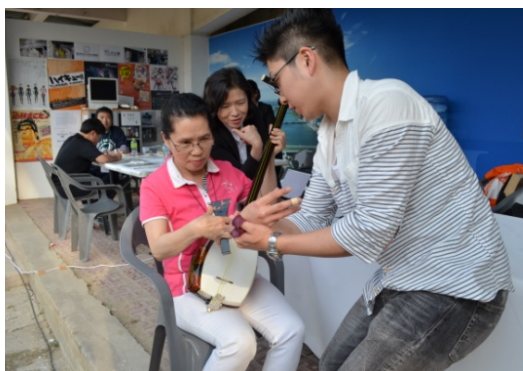
【新潟市】三味線体験