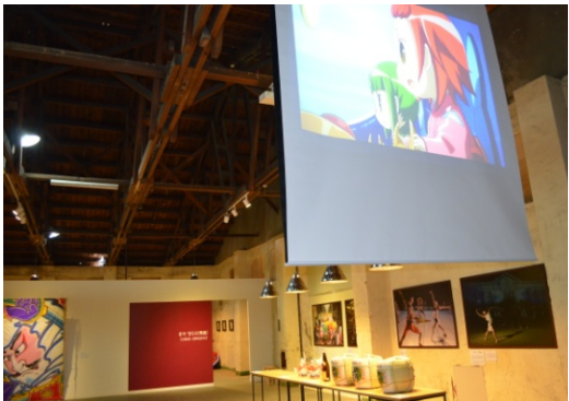
【新潟市】DVD 放映 (笹団五郎、花野古町アニメーション)