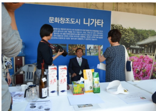
新潟日報記者による李承勳市長、韓国メディアへの取材