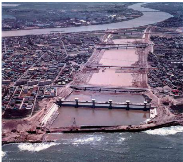
掘削がほぼ完了した関屋分水路 昭和46年6月

関屋分水路が完成したことにより、信濃川下流の左岸地域は「島」の形態となり、いわゆる「新潟島」ができた。