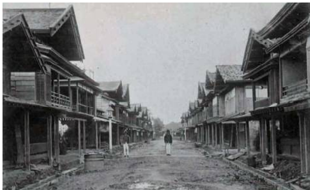
町並みの整備が進む明治初年の古町通一・二番町

池を生かして、築山を盛り、花壇や樹木・庭石を配置した庭園であった。新潟遊園は、明治6年に日本最初の公園の一つとして開園し、新潟町の新名所になった。