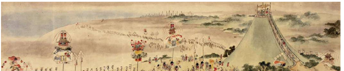
「蠶の手振り」新潟湊祭の行列 嘉永5(1852)年(県指定文化財)

湊祭は、新潟町が幕府領になってからはますます派手になり、新潟奉行が出し物の飾りを制限するほどだった。湊祭は現在、新潟まつりの住吉行列に名残をとどめている。