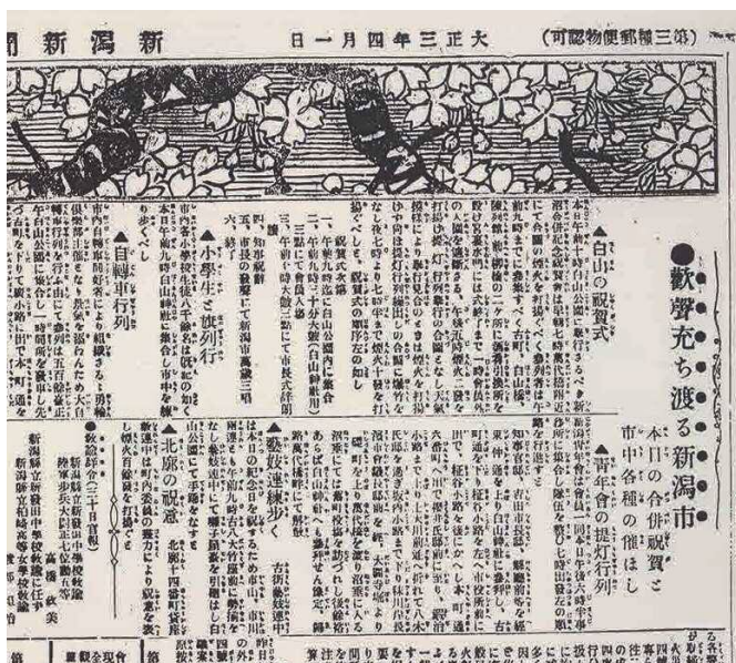
新潟と沼垂の合併を伝える「新潟新聞」大正3年4月1日付(部分)