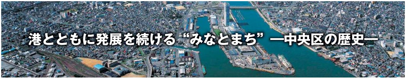
日本一の大河・信濃川の河口