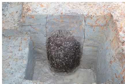
古代の柱(奈良時代)