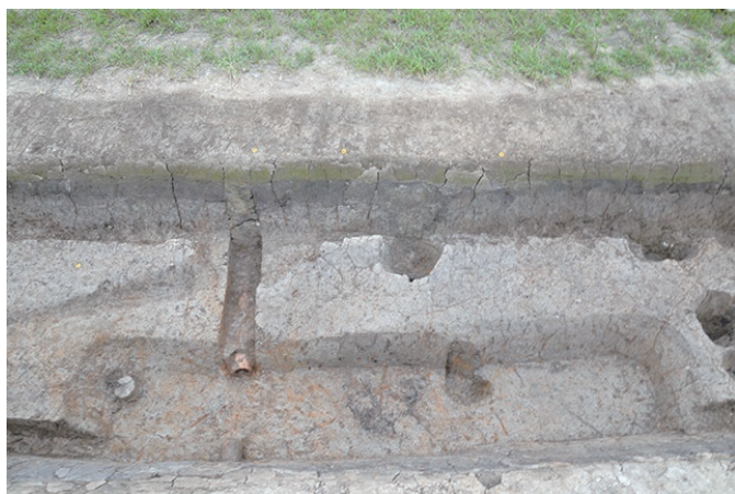
ろあと たてあなたてもの 炉跡のある竪穴建物(奈良時代)