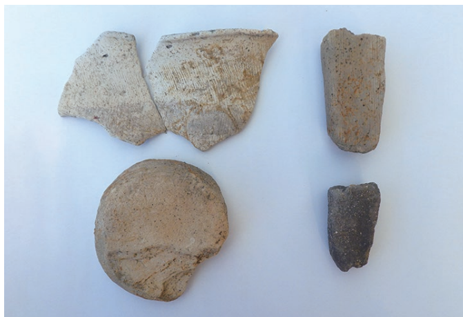
たてあなたてもの 竪穴建物から出土した土師器と土製品