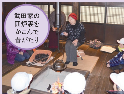
武田家の 囲炉裏を かこんで 昔がたり