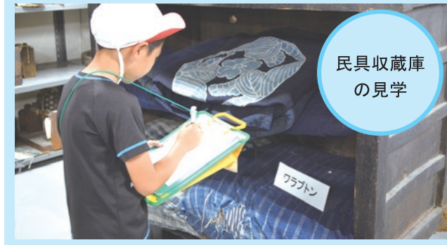
民具収蔵庫 の見学