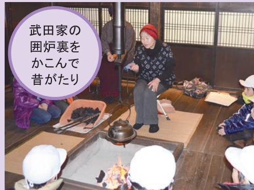
武田家の 囲炉裏を かこんで 昔がたり