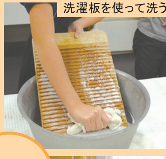
洗濯板を使って洗う