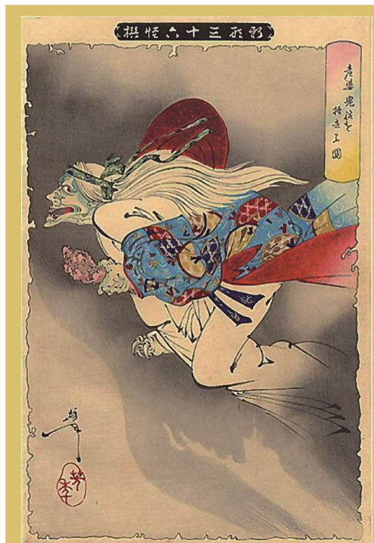
『新形三十六怪撰』より「老婆鬼腕を持去る図」 月岡芳年（つきおかよしとし、1839年-1892年） 渡辺綱の伯母に化けて自分の片腕を奪い返した茨木童子