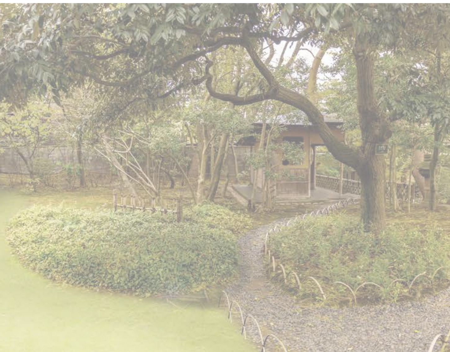
图 7-5 完成予想图 4「茶庭裸地化改善」