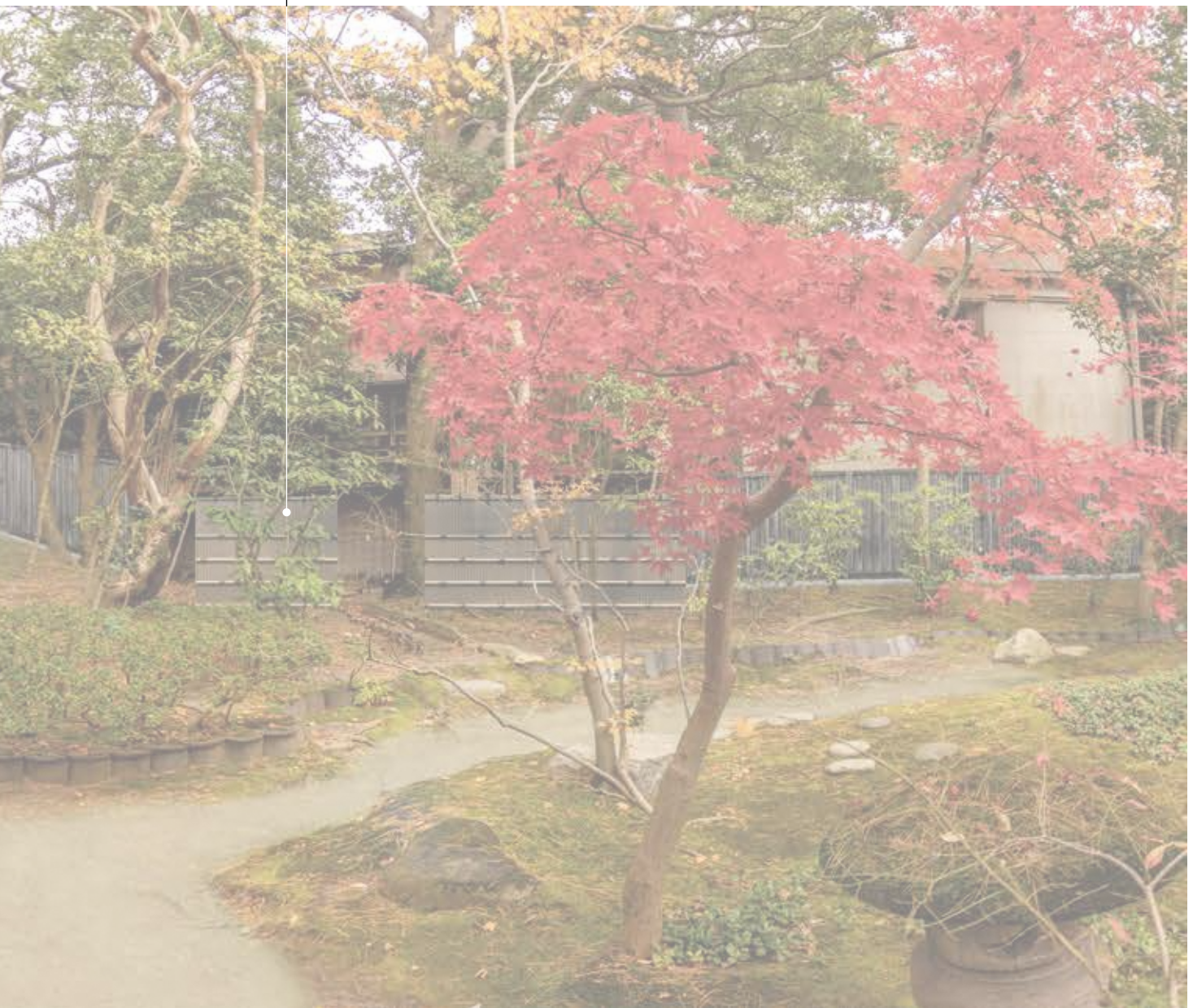
図 7-2 完成予想図 1「待合前斜面修理と資材置場修景」