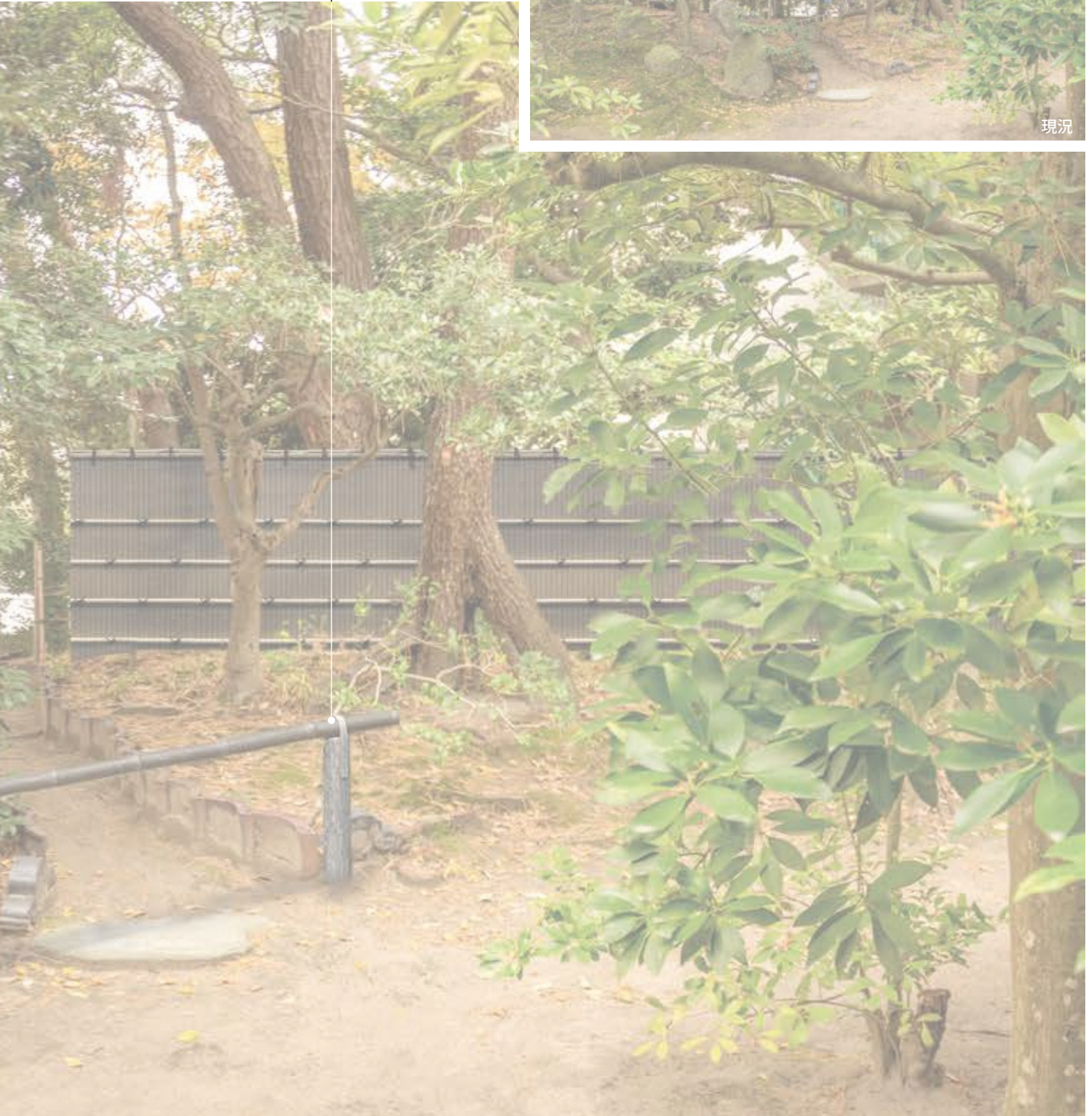
図 7-4 完成予想図 3 「北西管理用地遮蔽及び修景」