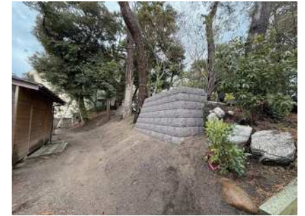
石積保存整備完了状況

繰越工事範囲は、昨年12月に現場作業が完了したところである。 既存石積が露出する部分は前回委員会での内容を踏まえヤシ繊維マットで養生する計画である。また、石積下の盛土部分は土流れ防止のため同じくヤシ繊維マットを敷設して、表土の安定化を図る。