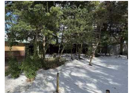
境界塀設置完了状況 (園路から臨む)