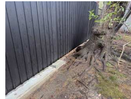
境界塀設置完了状況 (樹根干渉部分)