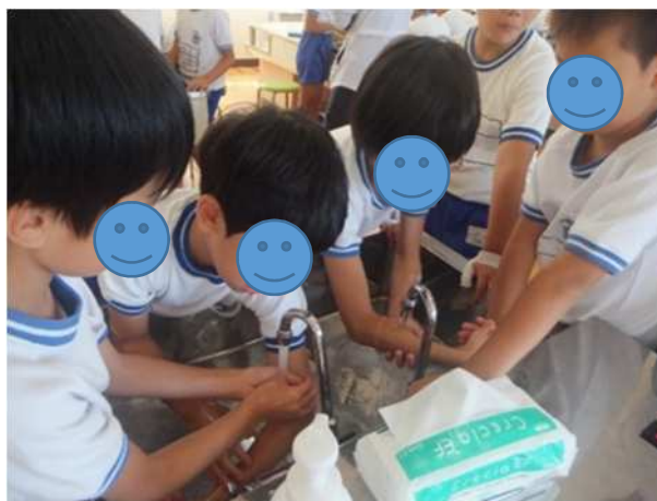
▲手洗い教室の様子