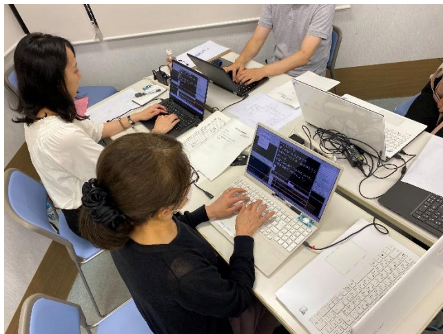
↑ パソコン要約筆記

話をそのまま文字にすると伝わりにくいため、話し手の意図をつかみ要約して伝えます。要約筆記の方法には、手書きとパソコンの2通りあります。