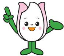
新潟市 食育・花育推進キャラクター まいかちゃん