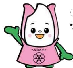
新井市健康・栄養推進キャラクター まいかちゃん

※申込み状況により、開催区にお住いの方を優先させていただく場合がありますので、ご了承ください。