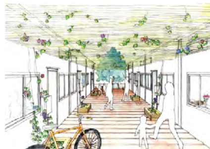
(上) ウッドデッキイメージ

などが配置される予定となっており、仮設住宅入居者の生活に資する機能を一体的に整備している。