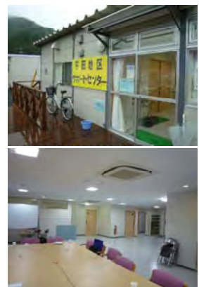
写真（上）サポートセンター外観、（下）集会室