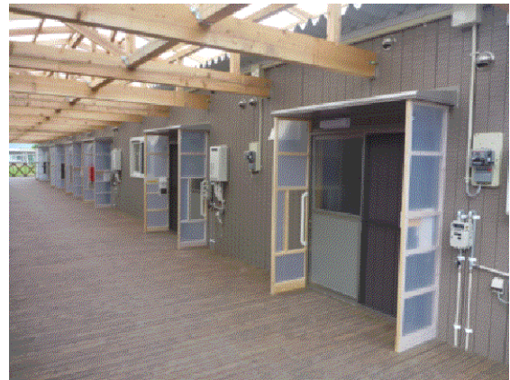
(右) ケアゾーンの仮設住宅